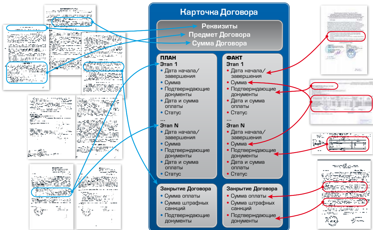
Рис. 2. Индексная информация и создание карточки договора

Все отсканированные образы документов индексируются — создается база данных учетных и поисковых реквизитов документов. Для каждого договора заполняется карточка, которая содержит исчерпывающую и достоверную (эталонную) информацию о сделке и ее плановом жизненном цикле: реквизиты и сумма договора, сроки начала и завершения этапов, суммы авансов, условия возникновения штрафных санкций, «долгосрочные» пункты, подлежащие контролю после завершения срока действия договора и т.д. (см. рис. 2). Карточка заполняется на основании фрагментов первичных документов.